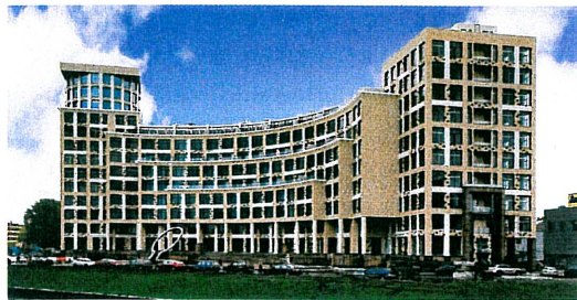
Wohnkomplex „Omega Haus“ am Pesotchnaja-Ufer