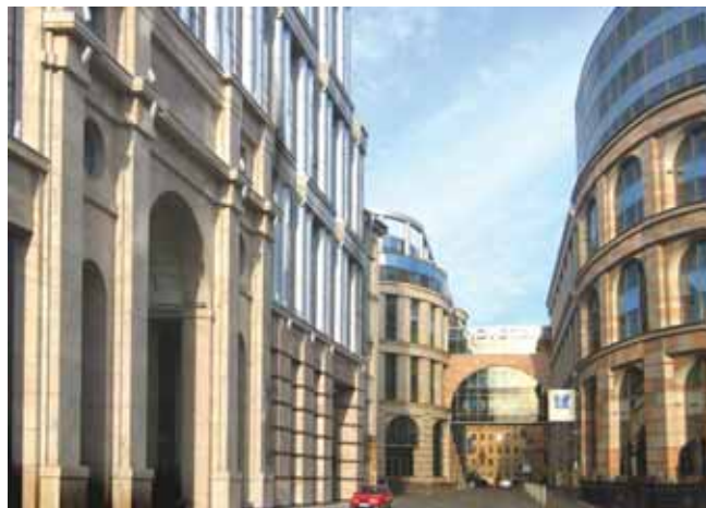
Такие сооружения появились на месте грязных проходных дворов.

НОВИЗНА. Исторический центр города многолик. Наряду с безусловными шедеврами и памятниками архитектуры в самом центре находятся труппы времен XIX века, находящиеся в полуаварийном состоянии и уж точно не украшающие наш город.